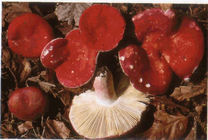
Russula rosea Harter Zinnober-Täubling | Russule rose

Indigestionen Es ist nicht leicht eine Grenze zwischen gastrointestinalem Frühsyndrom (GFS) und Indigestions-Syndrom (IS) zu ziehen. Das GFS ist die Domäne obligat giftiger Pilze mit ihren Brechdurchfällen innerhalb vier Stunden.