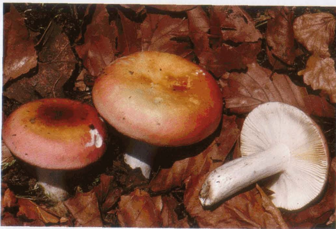
Russula velutipes Rosen-Täubling | Russule floconneuse