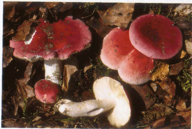
Russula rubra Cremesporiger Spei-Täubling | Russule rouge cinabre